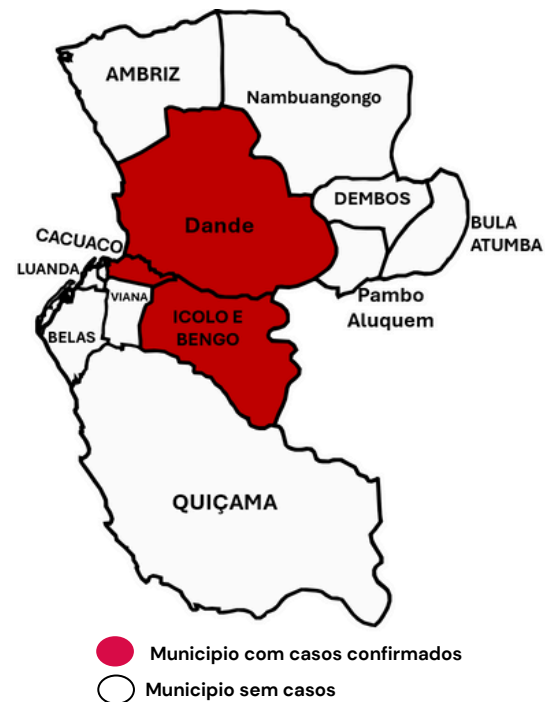
MAPA GEOGRÁFICO DE LUANDA, BENG E ICOLO E BENG